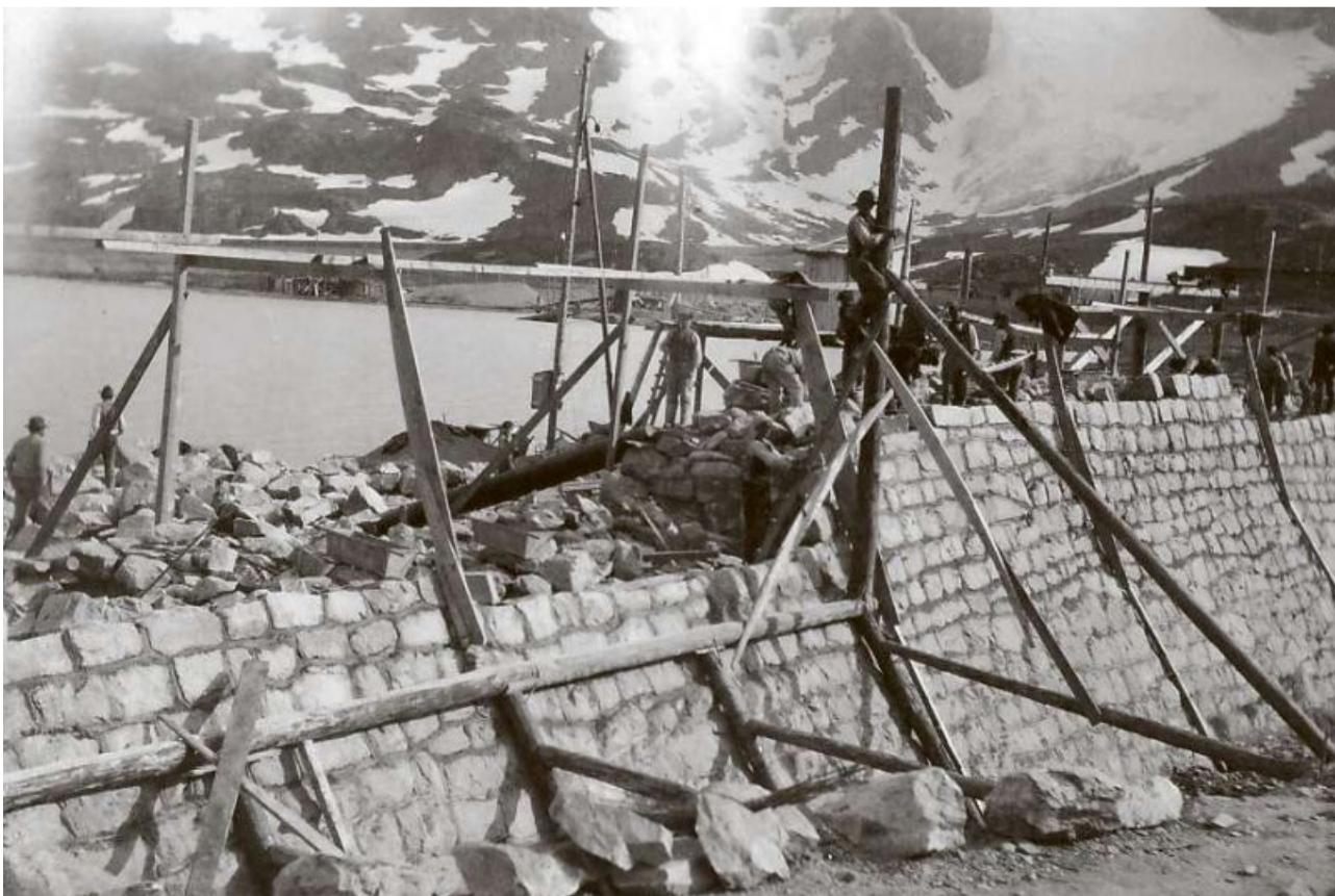
Il mir da fermada en il ost dal Lago Bianco en plaina construcziun, durant la segunda stagiun da bajegiar l'onn 1910.

Las fotografias pon vegnir guardadas electronicamain. Tgi che vul, las po era telechargiar u empustar a moda squitschada suenter consultaziun: www.fotogr.ch ubain https://istoria.ch/archivio-repower/ .