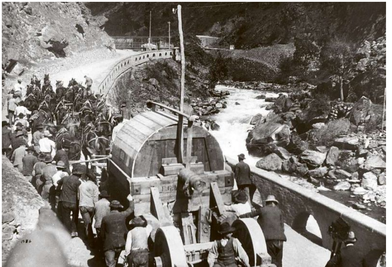
La pli veglia fotografia da l'archiv: 20 chavals transporteschan in «polrades» (la part rotanta d'in generatur) per ina gruppa da maschinas da l'implant a Campocologno l'onn 1905. En il chantun dretg è da vesair in fotograf cun stativ ed ina «Balgenkamera».